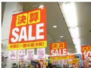
・タペストリー サイズ：H1200×W1200ミリ 材質：ポンジ 色：2/0C 加工：上下部袋縫い プラフック付き 防炎加工