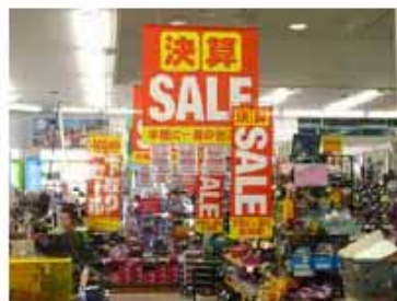
・ミニタペストリー サイズ：H1200×W400ミリ 材質：ポンジ 色：2/0C 加工：防炎加工 上部塩ビ板加工