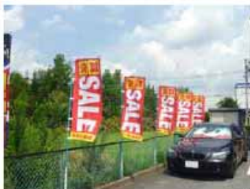
・のぼり サイズ：H1500×W700ミリ 材質：ポンジ 色：2/0C 加工：左ミミ