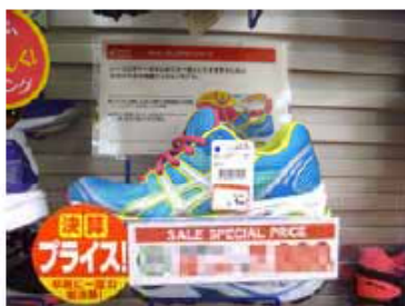
・アイキャッチャー サイズ：H80×W100ミリ 材質：コート135キロ 色：2C/2C(別版) 加工：両面グロスPP加工